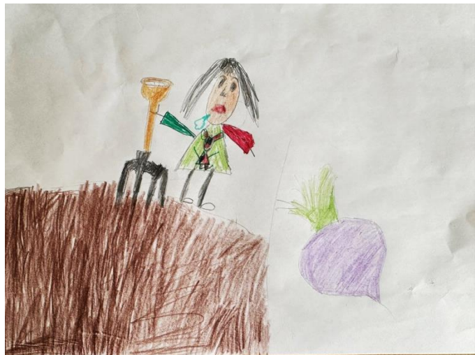
Рисунок ребенка 3

В огороде Фёкла ахала и охала, -Уродилась свёкла не на грядке - около. Жалко Фёклу, жалко свёклу, Жаловалась Фёкла: -Заблудилась свёкла!