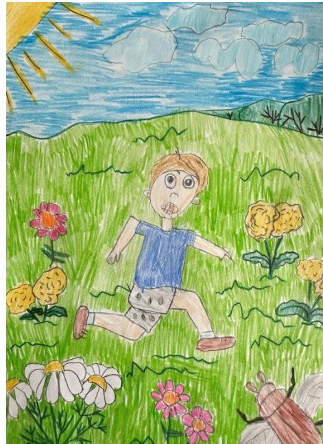
Рисунок ребенка 2

Жу-жу-жу, жу-ужу-жу! Над лужайкой я жужжу! Над цветами я кружу, Безобидно я жужжал, Что же Женя убежал?